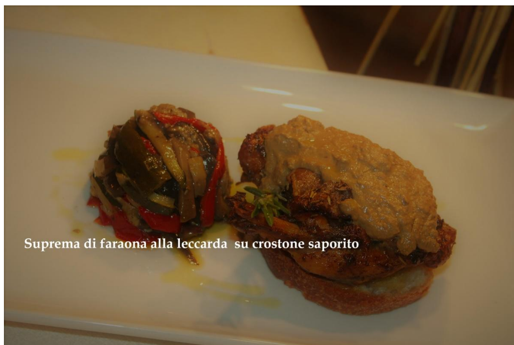
Suprema di faraona alla leccarda su crostone saporito

Carrè di agnello in crosta di miele e nocciole , accompagnato da tortino di verdura ripassata in padella (8) € 19