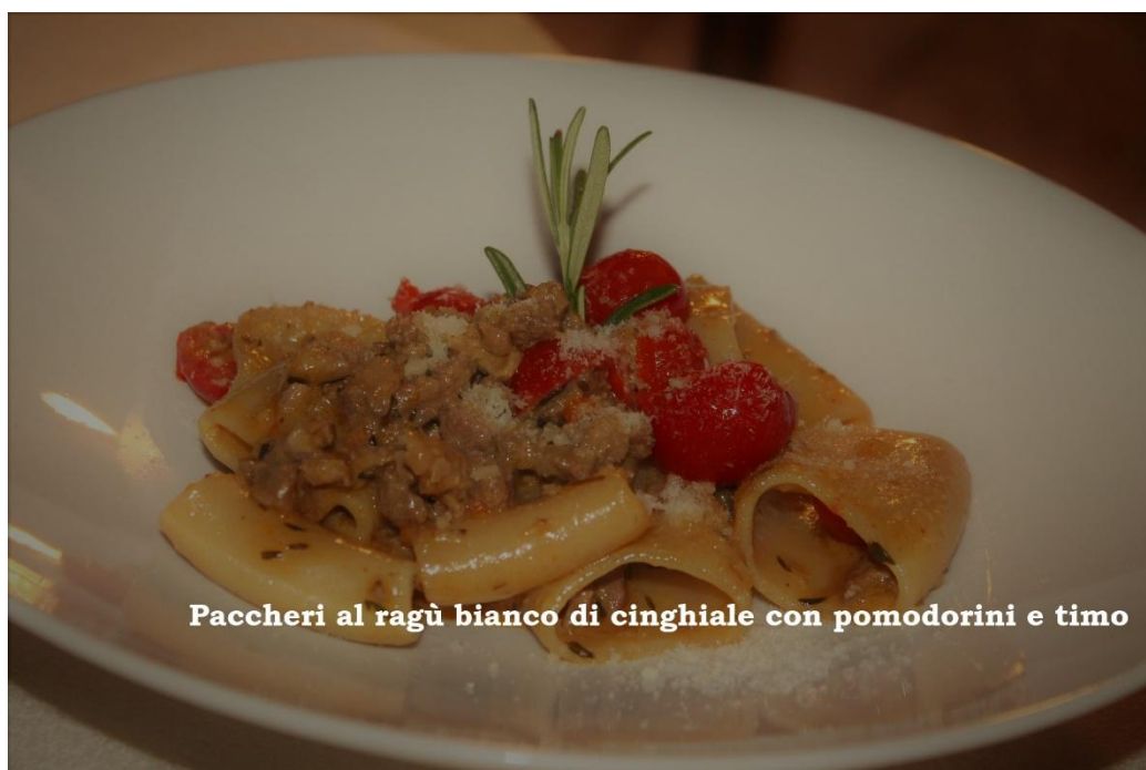
Paccheri al ragù bianco di cinghiale con pomodorini e timo

Tagliatella rustica ai funghi porcini (1-3-7) € 12